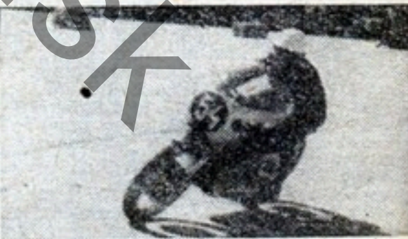
Vítěz dvěstěpadesátek - Klaus Enderlein na MZ