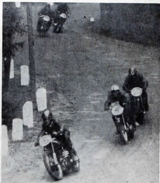
Obrázek vlevo: Trať závodu »Přes dva mosty« se vyznačovala jak obtížnými zatáčkami, tak i delšími rovinkami. — Obrázek vpravo: Skupina závodníků ve triuě do 500 ccm v dvojité serpentině.