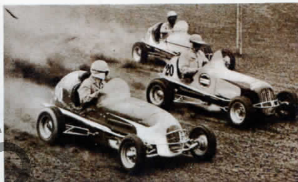
Američania priviezli do Británie nový spôsob automobilového pretekania na malých strojoch Midget. Prvý takýto podnik bol vo Veľkej Británii 10. mája t. r.