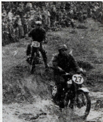
Záběr z terénního závodu v Brodčích.