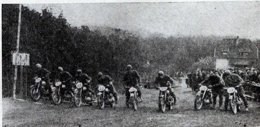
Start třídy do 350 ccm v Brodeckém terénním závodě.

(t) Od počátku letošního roku vstoupily v platnost nové ceny pneumatik ve Velké Británii. Byly proti loňsku zvýšeny o 20%. Toto zvýšení cen pneumatik se nevyhnutelně odrazilo ve zvýšení tarifů silniční dopravy. Veliký válečný rozpočet Anglie je příčinou tohoto zvýšení cen, které postihuje řady jiných produktů. Zvyšováním cen a zvyšováním daní se značně snižuje životní úroveň britského lidu.